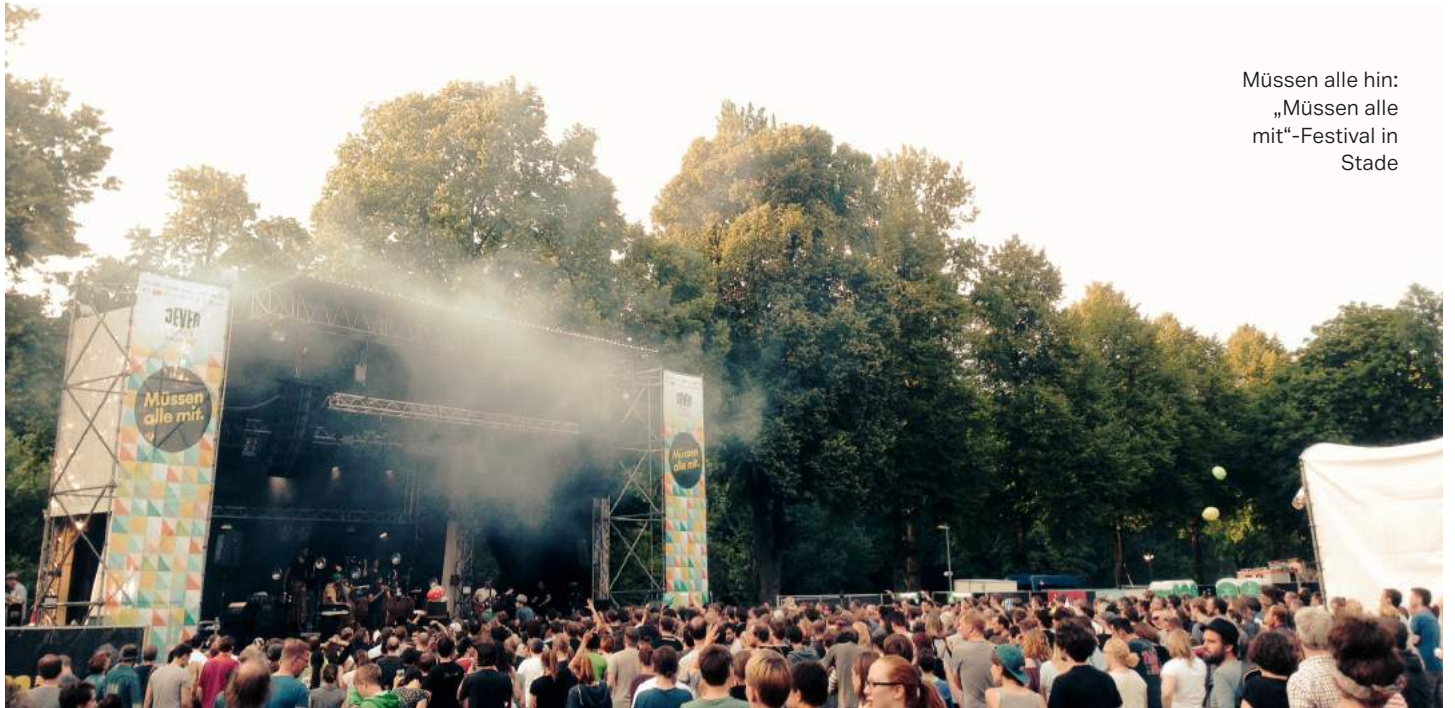
Müssen alle hin: „Müssen alle mit“-Festival in Stade