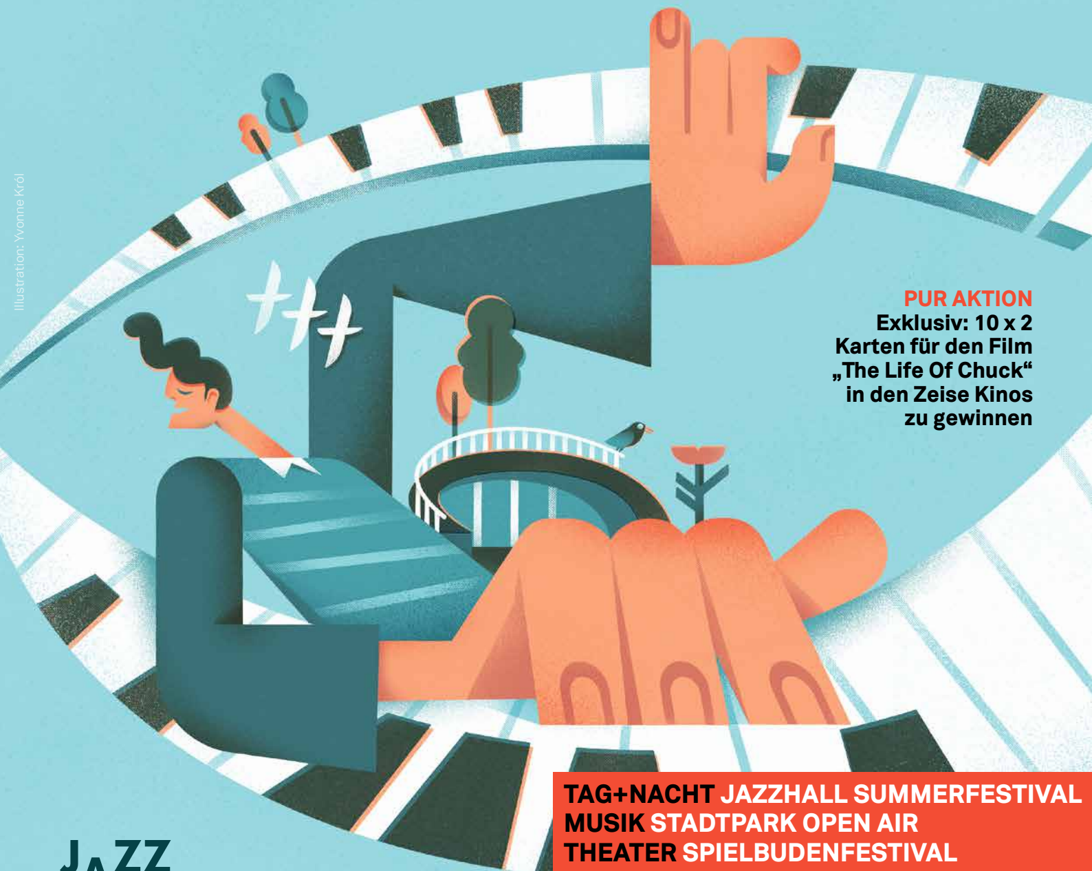
Illustration: Yvonne Kröl